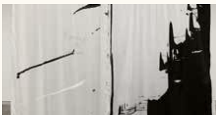
Le terrain de tous les possibles. 2020

JOËL ANDRIANOMEARISOA Artiste majeur de la scène contemporaine internationale, Joël Andrianomearisoa reste attaché à ses racines, Madagascar. Artiste du premier Pavillon de Madagascar à la 58ème Biennale d'art de Venise en 2019, ses installations emportent dans un univers de désirs, matérialisent la beauté de l'émotion. Architecte de formation, l'espace est son inspiration, les matières l'objet de ses manipulations; son œuvre, sensible nous laisse apercevoir la lisière des sentiments, le "nu de la vie".