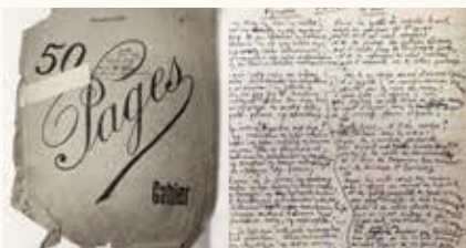
Manuscrit - Presque-songes. 1931

JEAN-JOSEPH RABEARIVÉLO (1901-1937) écrivain emblématique malgache du XX e siècle. Jean-Joseph Rabearivelo incarne les contradictions d'une société que le joug colonial avait profondément déstabilisée. Son œuvre montre les grandes affinités avec les poètes symbolistes et surréalistes de son époque, tout en restant profondément enracinée dans la géographie et le folklore de Madagascar. Romans, poésies, pièces de théâtre, critiques littéraires, journal personnel, l'auteur a laissé de nombreux écrits, dont la plupart, inédits jusqu'en 2010. Révélée aujourd'hui, son œuvre incontournable, place ce grand écrivain au panthéon de la littérature malgache et francophone.