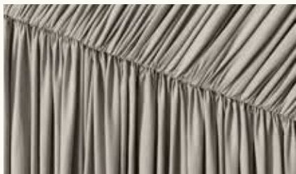
Les horizons. 2020